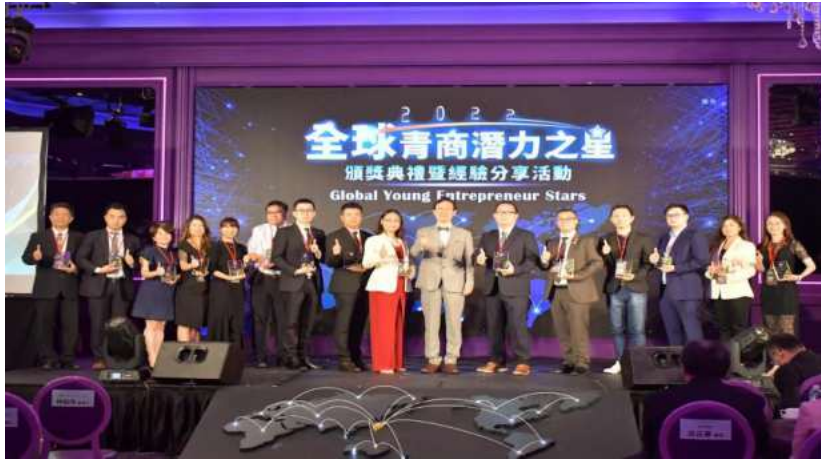
全球青商潛力之星專區